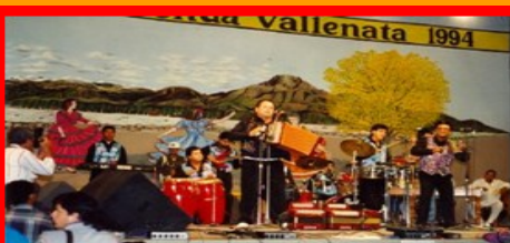
Presentacion Los Pimentosos na Valledupar Colombia 1994

“La Cacica”. La Nueva Fuerza tabata un di e prome bandanan di Aruba cu a presenta den exterior, cu hopi exito tambe. Elvia ta corda cu nan a haya invitacion pa presenta na Baranquilla y Cartagena. Den “Templo de Cleopatra” tabata un di e luganan cu nan a presenta varios biaha. Tambe nan a presenta riba un escenario riba beach cu tabata algo inolvidabel cu un acogida grandisimo. Nan exito e tempo ey tabata “Mi Banana”. Los Pimentosos a comparti escenario cu Binomio De Oro, Los Hermanos Zuleta,